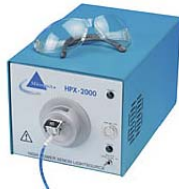
HPX-2000 Spectral Output