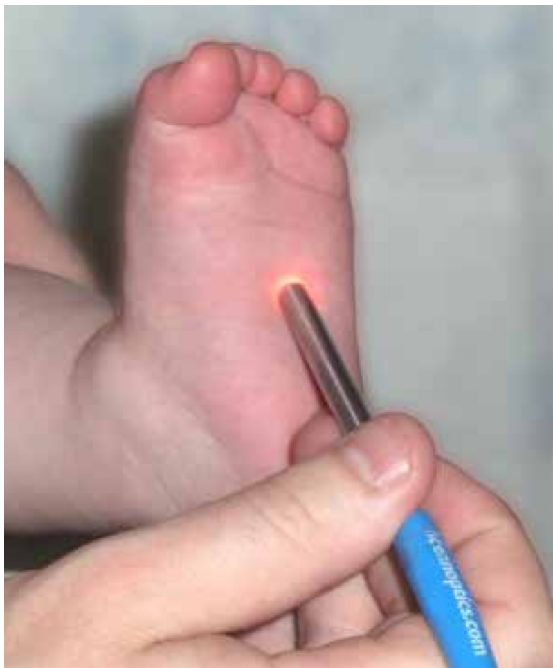
図 1: 光学分析は新生児の痛みがなく、迅速なビリルビン値測定技術です。

元々この方法は非常に痛みを伴う方法です。。さらにこの診断を行うには 1 時間以上かかるため、処置に遅れが生じます。