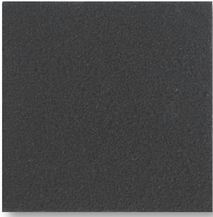
Durable and Versatile Spray-on Coating

The only choice when durability matters most