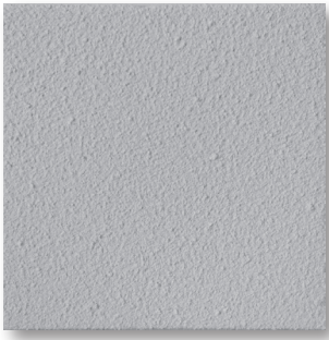
Durable and Versatile Spray-on Coating

The only choice when durability matters most