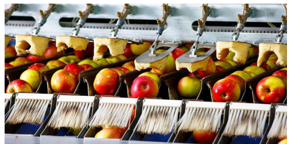
例：食品選別アプリケーション—高速測定に最適